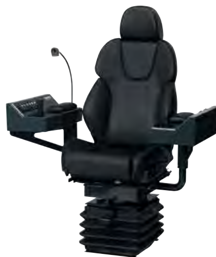
Interfaces sur mesure